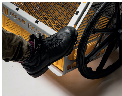
Cómodo cambio de caja mediante rejilla de pie