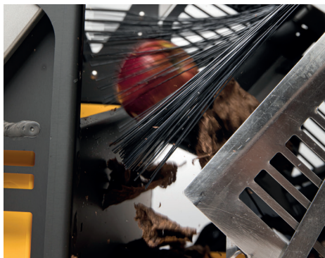
El cepillo para separar las hojas

El sistema patentado de pre-limpieza separa las hojas y la hierba de la fruta mediante un cepillo de hojas. Debido a su mayor peso y, por tanto, a su fuerza, las frutas y los frutos secos pueden deslizarse a través del cepillo hacia la caja. Sin embargo, las hojas y la hierba que se han recogido son detenidas por el cepillo filtrante y vuelven a caer por el hueco en el campo.